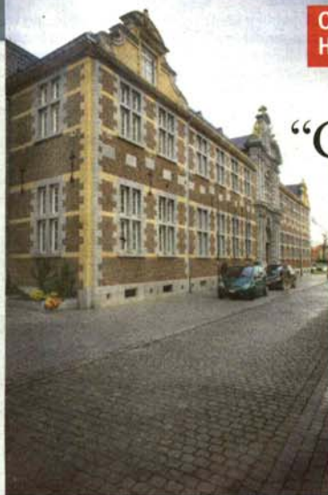
Oud Gasthuis Hasselt