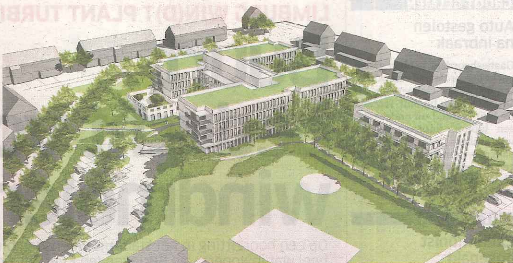
De nieuwbouw aan de Banneuxwijk is goed voor 120 woonegelegenheden.