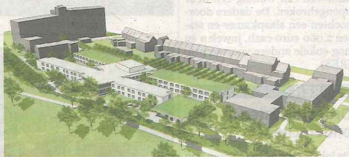
De zorgcampus Zonnestraat wordt heringericht en krijgt twee extra vleugels.

Het OCMW hoopt volgend jaar te starten met de eerste werken zodat in 2014 de eerste voorzieningen in gebruik kunnen genomen worden. De vergunning van campus Zonnestraat verloopt namelijk dat jaar. Het totale plan zal ongeveer 38 miljoen euro kosten. Het OCMW en de stad hopen om ongeveer vijftig procent te incasseren via subsidies van de Vlaamse overheid.