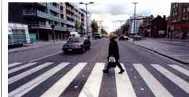
'De Europalaan is niet meer dan een streep design.' © jeh

'Het stadsbestuur experimenteert, denkt na over zijn stads-evolutie. Men overweegt bijvoorbeeld om bepaalde kavels op te zadelen met slechts één bouwregel en de rest van onder naar boven te laten groeien. De kavelbewoners zoeken samen dan naar oplossingen.' 'Hasselt-centrum is duur, er leven maar 2.000 mensen. Toch sta ik niet achter de politiek om bij alle nieuwe projecten 15 procent sociale woningen te plannen. Dat is antiproduktief.' (pdp)