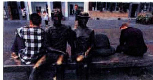
'Hasselt is organisch gegroeid.'