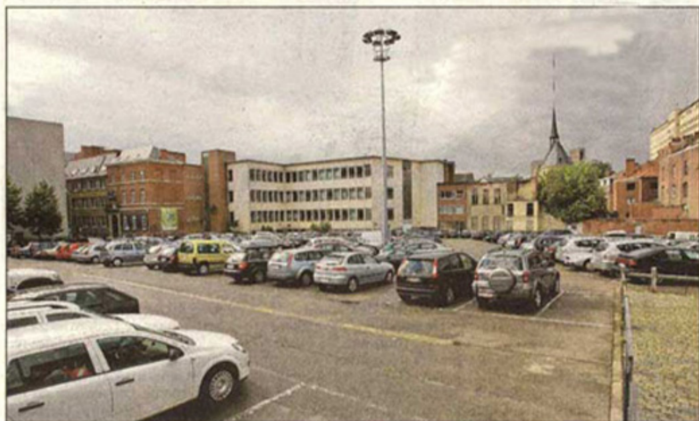
De actuele parkeerplaats van de Boerenbond. Op de achtergrond de Predikherenkerk.