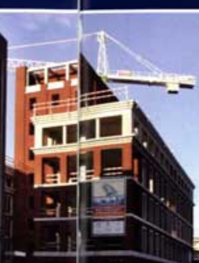
Clockhempoor - St-Truiden