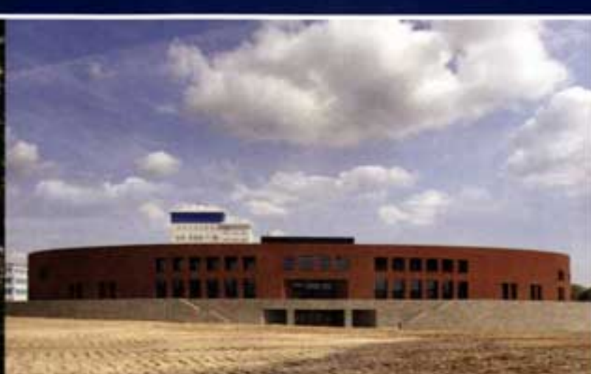
Sportplaza - Philipssite - Leuven