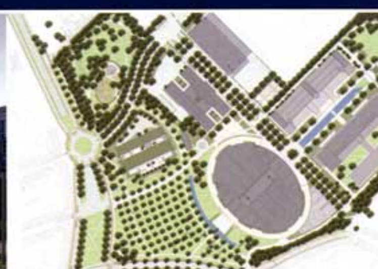
Masterplan - Philipssite - Leuven

voelen, gemotiveerd zijn om daar te werken, en dat na een aantal jaren nog zien zitten, enz.... Het is veel complexer dan één of een paar opvallende gebouwen "droppen". Ons motto is resoluut 'Design is de vijand!'. Van zodra een architect meer met het beeld bezig is, dan met de inhoud, de functies, het achterliggende verhaal, kortom met de "samenhang", loopt het fout, en krijg je gebouwen met een waw!-effect, maar die in realiteit meestal niet werken. Je kan zo'n dingen overal neerzetten, zonder enige relatie met de omgeving. Net zoals een restaurant van McDonalds. In het beste geval kan je dat een kunstwerk noemen, dat er kan bekeken worden. Maar architectuur heeft niets van doen met kunst en moet toch meer zijn dan een louter kijkstuk. Toch?