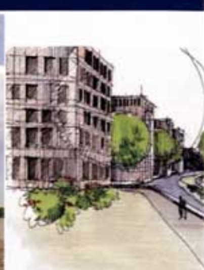
Hertogendal - Leuven