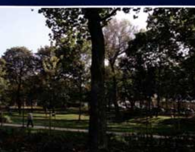
Park - Leuven

ADG: Leopold II, daar zeg je al zoiets. Hij heeft naar het voorbeeld van Haussmann in Parijs wel de helft van de Brusselse binnenstad laten platgooien. Brussel is sindsdien een getekende, getraumatiseerde stad. Het heeft zich in de jaren '60 herhaald met de afbraak van de Noordwijk (zie wat er in de plaats is gekomen!) en nu weer met de zgn. Europawijk. Altijd gaat het om zeer beeldmatig geïnspireerde architectuur, die het van het effect en het prestige moeten hebben, nooit van wat mensen echt nodig hebben. Een stad of een wijk ontwerpen heeft veel meer te maken met subjectieve aspecten; zich daar thuis