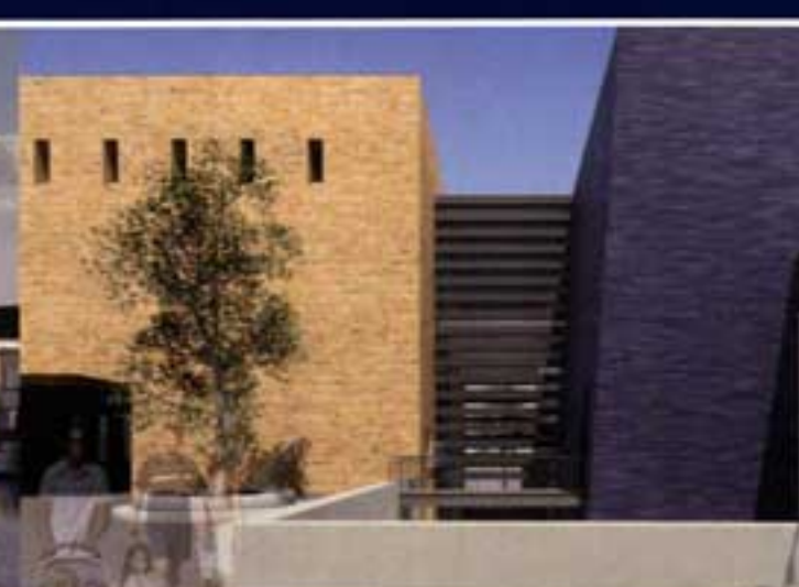
Gallo-Romeins Museum - Tongeren