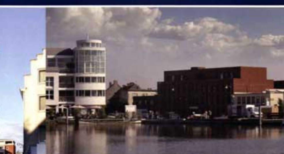
De Nieuwe Kaai - Turnhout